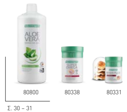
Σ. 30 – 31