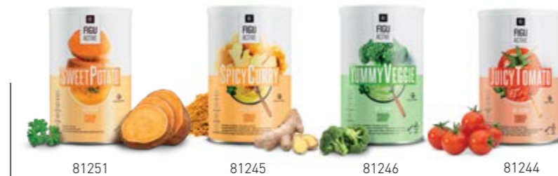
Σ. 44 – 45