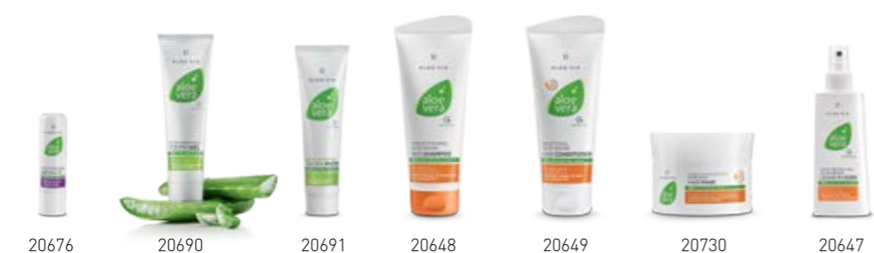
Σ. 66 – 67