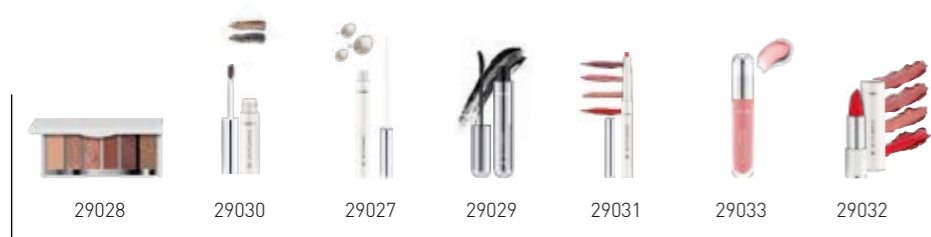
Σ. 90 – 91