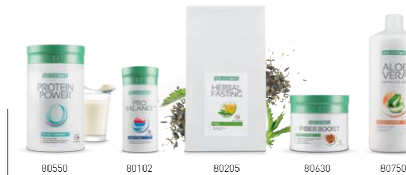
Σ. 48 – 49