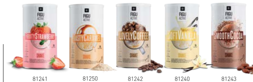
Σ. 42 – 43