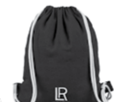
Κωδ. Παρ. 95598