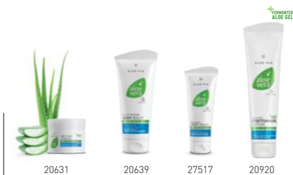
Σ. 64 – 65