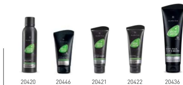
Σ. 68 – 69