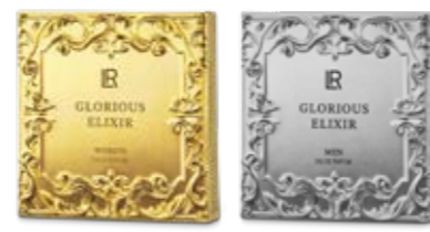
Κωδ. Παρ. 97543