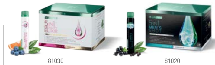
Σ. 38 – 39