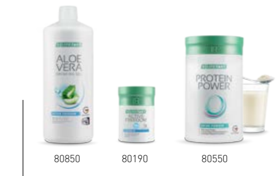
Σ. 34 – 35