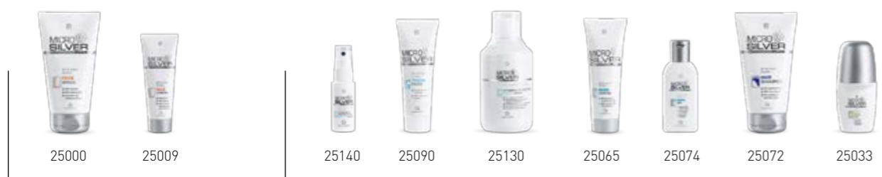
Σ. 92 – 93