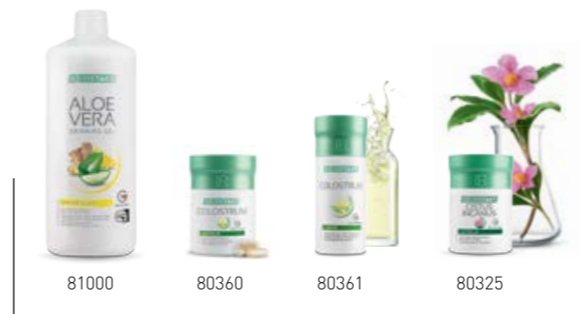
Σ. 32 – 33