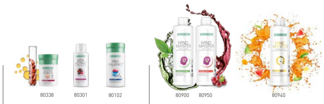
Σ. 24 – 25 Σ. 26 – 27