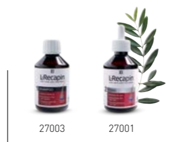
Σ. 96 – 97