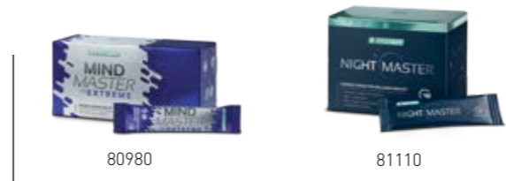
Σ. 28 – 29