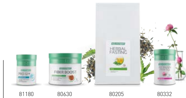
Σ. 36 – 37