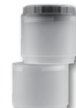
Κωδ. Παρ. 8130