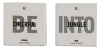
Κωδ. Παρ. 97541