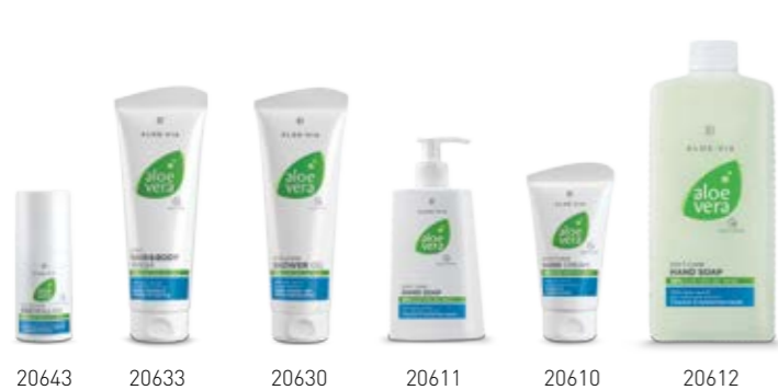
Σ. 62 – 63