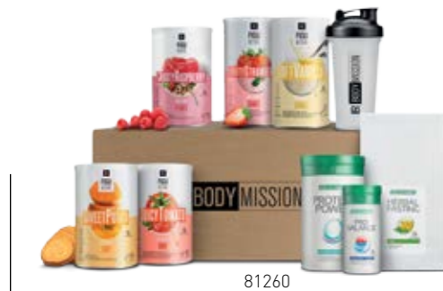
Σ. 40 – 41